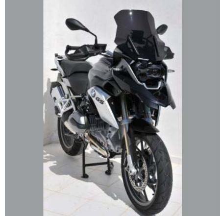
BMW R1200GS LC