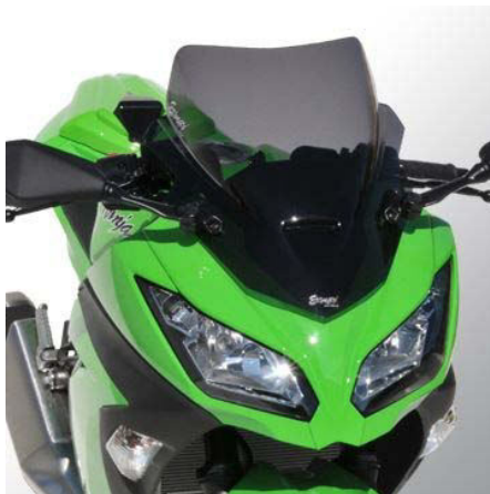
Kawasaki Ninja 300