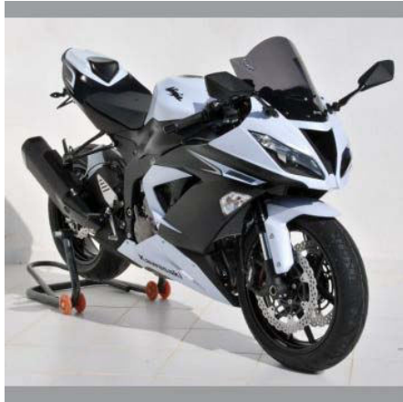
Kawasaki ZX6R 636